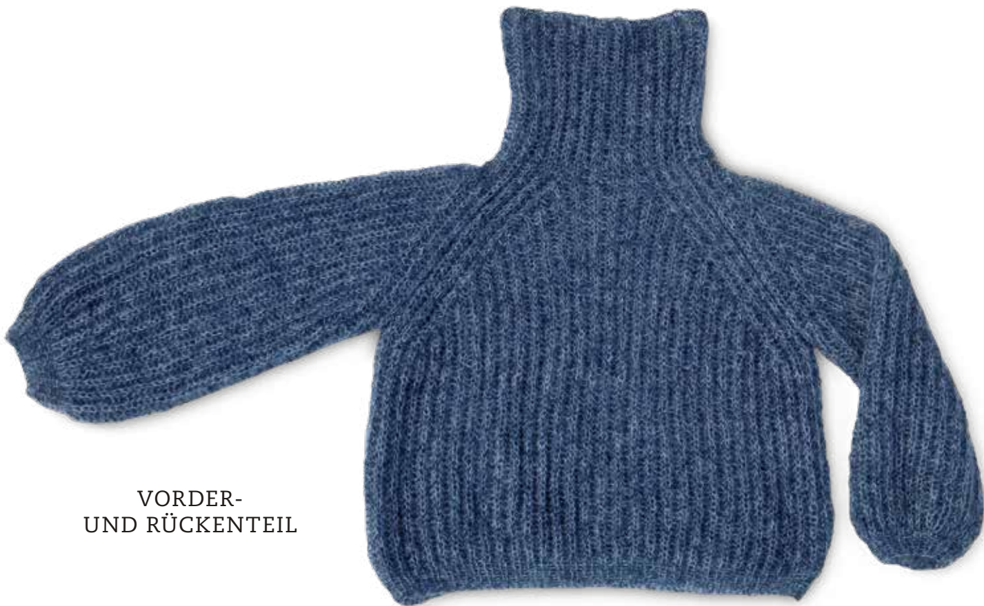
VORDER- UND RÜCKENTEIL