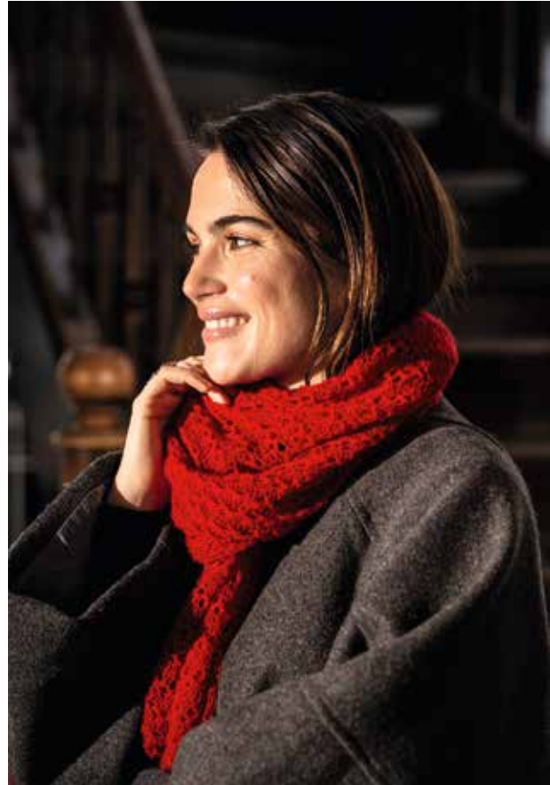
Als Schal um den Hals geschlungen, wärmt das Strickteil an kalten Tagen.