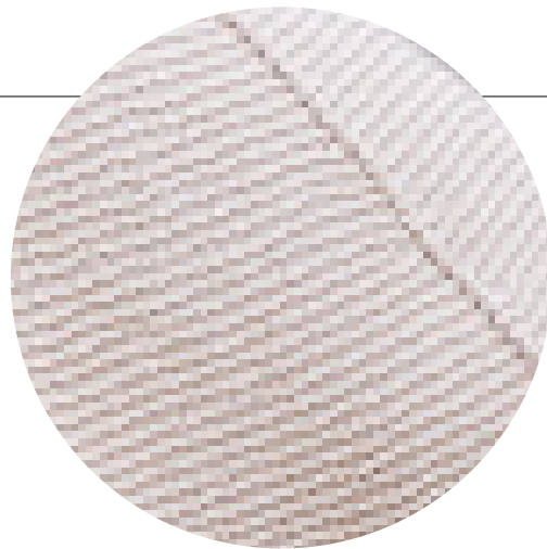
Die Seitenteile mit festen Maschen zusammenhäkeln, um die Nähte zu betonen