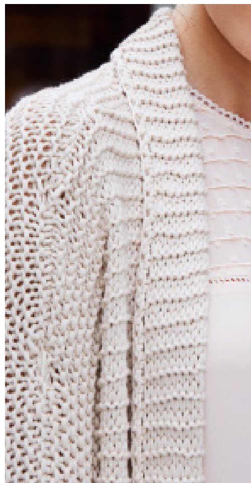
Sämtliche Kanten sind mit festen Maschen umhäkelt.